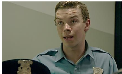
Will Poulter, más que un psicópata, un malo con cara de "buena persona" enfurecido por su propio personaje.

La interpretación de Will Poulter, me parece convincente y singular, es uno de los más afortunados y complejos registros de este joven actor cuya mirada inspira una extraña compasión hacia el personaje, con la que muchos no estarán de acuerdo. Es joven, quizá las circunstancias sociales, la educación recibida, su función dentro de la función le han llevado al extremo de la cobardía, de creerse su propia mentira, de hacer digna su indignidad. Terrible juego de contradicciones, hay una persona a años luz, detrás, de este personaje que no es un esbirro ni un teleñeco, es un ser de carne y hueso.