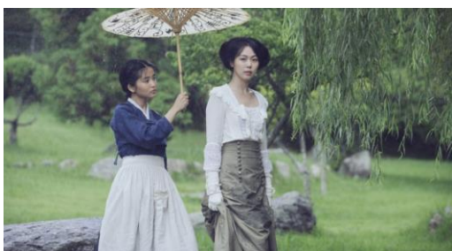
Las dos protagonistas comienzan como criada y señora para acabar como iguales.

Las dos mujeres romperán con sus correspondientes destinos, cada una en un momento distinto del film. En un principio por las propias circunstancias las dos son rivales, tanto por cuestiones de clase como por los engaños propuestos por los hombres, sin embargo pronto se deshacen de esos condicionantes para empezar a vivir su propia historia.