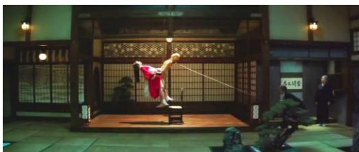
Hideko representando una de las escenas de uno de los libros eróticos.

sufrimiento, ha logrado en la dama suprimir cualquier muestra de instintos o pasiones. Fuera de las lecturas, Hideko tendrá prohibido mostrar cualquier tipo de deseo o iniciativa, principalmente en el ámbito sexual, pero también en muchos otros aspectos de su vida. Esta educación también ha impedido cualquier contacto con el mundo exterior, creando en la casa un micromundo del que sólo los habitantes tendrán un acceso completo. El final del film retoma la historia de Sook-Hee para mostrar un desenlace sorprendente y bastante agradable.