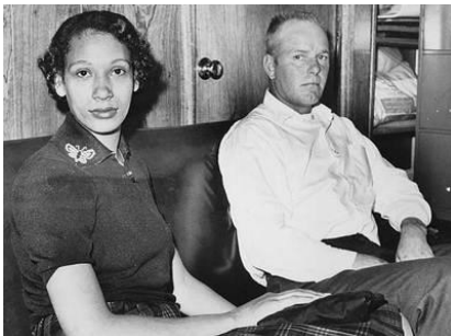
El matrimonio Loving en 1965